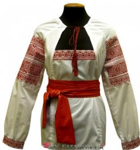
сорочка з уставками