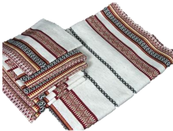
скатертина і серветки