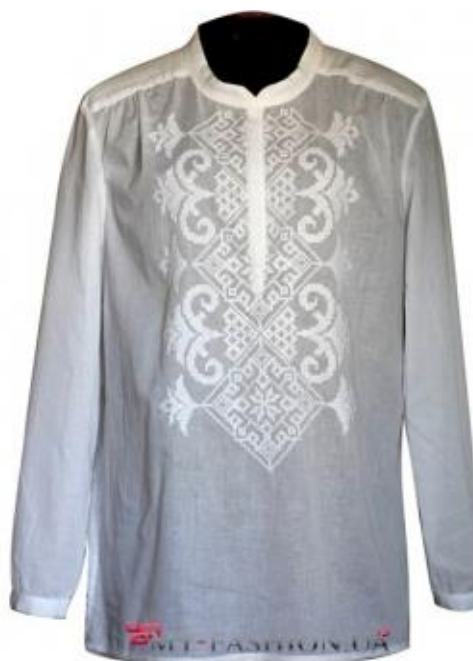
сорочка з кокетками