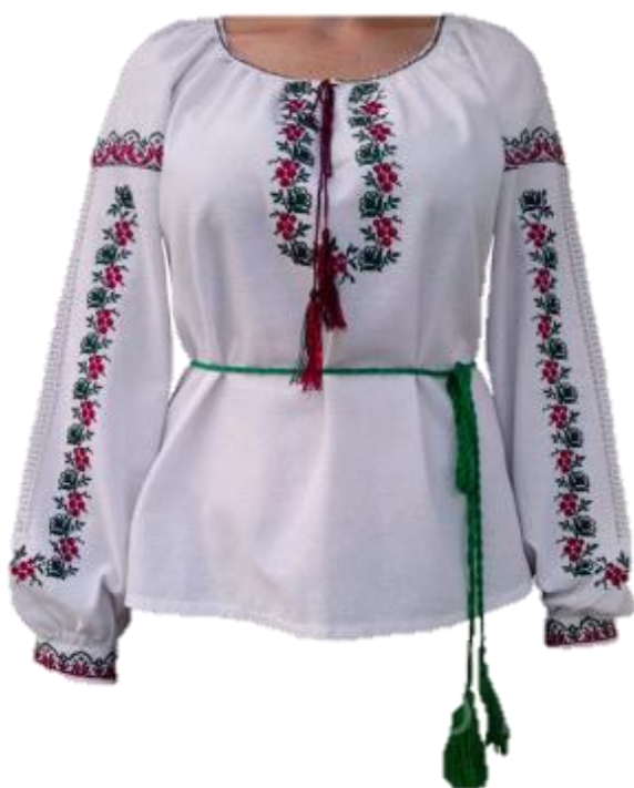
з суцільно-кроєним рукавом