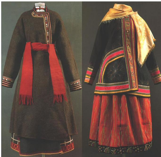
юпка-свитка і кабат