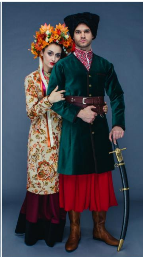
жупани жіночі та чоловічі