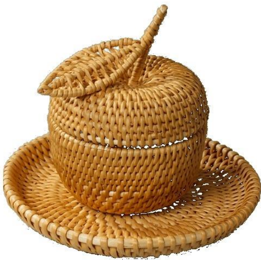
цукерниця з соснового кореня