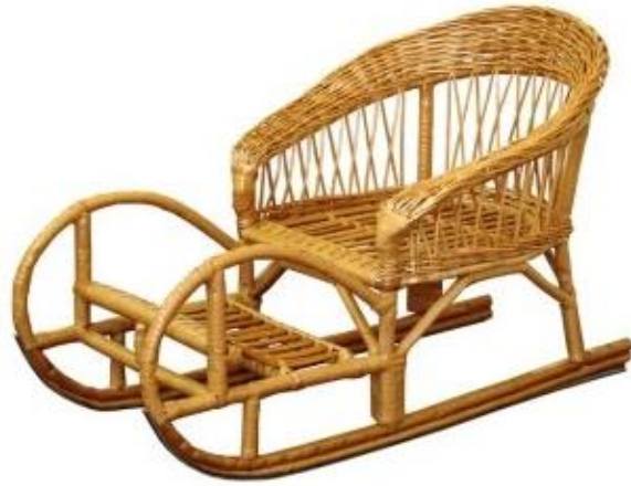
Рис. 4.6. Плетені вироби з лози