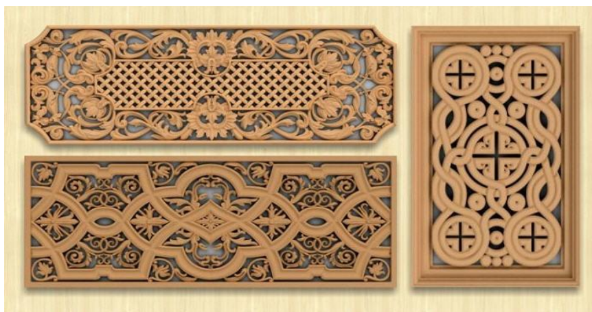
Рис. 4.2. Ажурне різьблення

Ажурне різьблення нагадує плоскорельєфне, має наскрізь прорізане тло. Найскладніше за технікою виконання (з рельєфним і ажурним характером мотивів) так зване «сніцарське різьблення» при виготовленні іконостасів, культивоване у XVII–XIX ст. цеховими різьбярами (рис. 4.2).