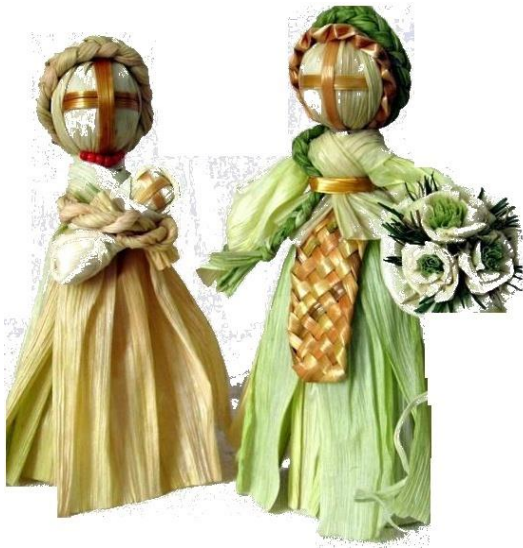
ляльки з листя кукурудзяних качанів