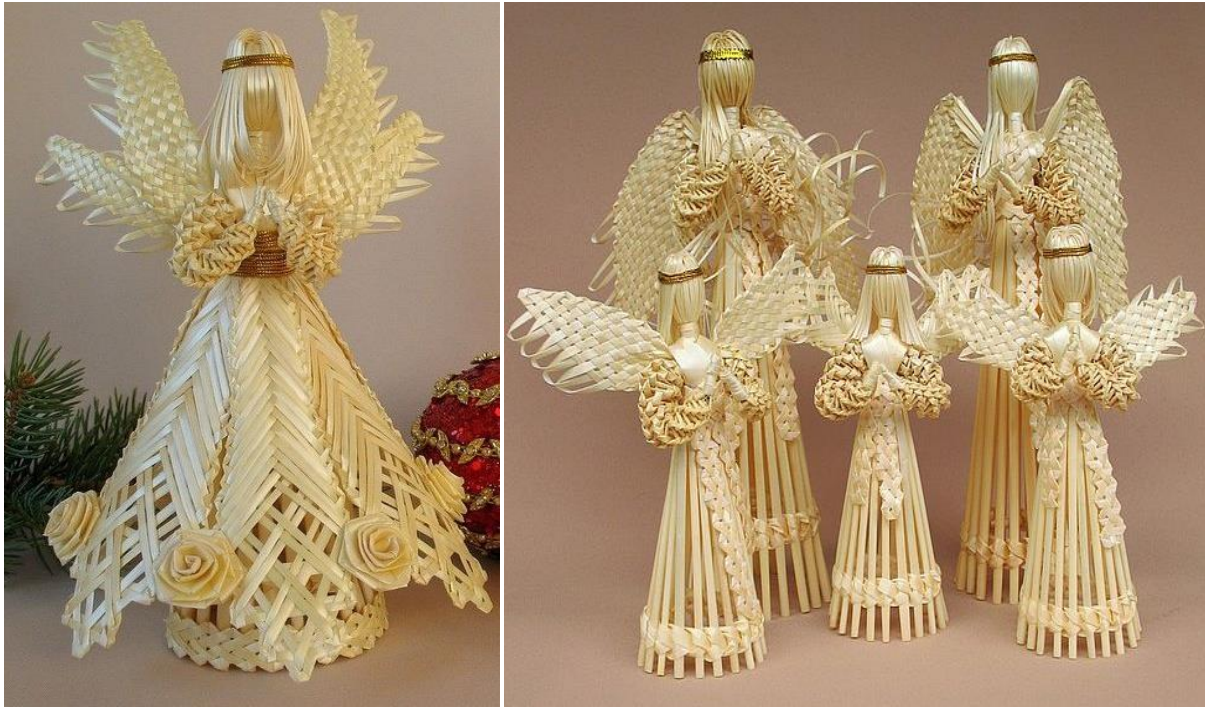
Рис. 4.8. Обрядові вироби з соломи

У наш час на Закарпатті набули поширення вироби, плетені з обгортки качанів кукурудзи. Такі обгортки вирівнюють, вибілюють, фарбують та розділяють на стрічки для плетення кошичків, торбинок тощо. Художня виразність плетених виробів значною мірою залежить від тієї чи іншої техніки виконання. За зовнішнім виглядом плетеної площини розрізняють просте суцільне, візерунчасте й ажурне плетіння, зшивання (рис. 4.9). Суцільне плетіння характеризується щільністю й простотою фактури виробу, яка створюється шляхом переплетення навхрест вертикальних каркасних прутів з горизонтальними стрічками. Хрестикова техніка – одна з найдавніших і нагадує звичайне ткання. Залежно від способу переплітання прутів, між ребрами каркасу розрізняють такі її різновиди: плетіння просте, шарами, рядами, квадратами та мотузкою. Окремо необхідно сказати про косу хрестикову техніку, яка застосовується лише для плетіння серветок і килимків із соломи. Спіральна техніка суцільного плетіння дає змогу прослідкувати послідовність роботи майстра і рух витків, що завжди починається від центру основи і йде по спіралі вбік і вгору. Розрізняють спіральну-валикову (для плетіння із соломи) та спіральну-каркасну (для плетіння з лози й коріння) техніки.