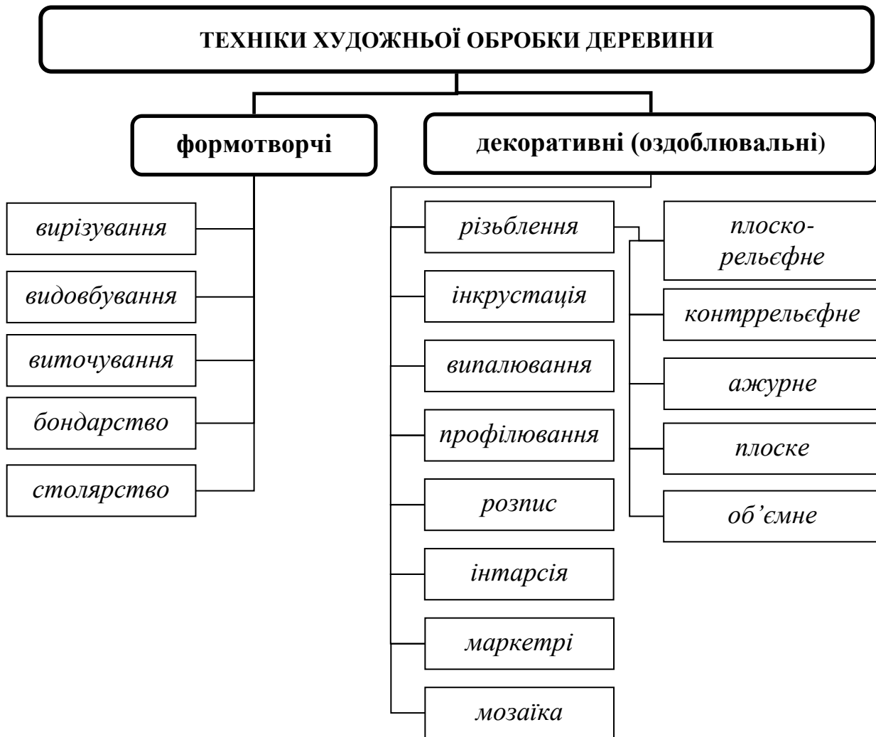
Рис. 4.1. Основні техніки художньої обробки деревини

Виточування – техніка обробки дерева і самостійна галузь народного художнього промислу (токарство). У процесі обертання дерев'яну заготовку на токарному верстаті обробляють плоскими і півкруглими долотами, фігурними різцями, гачками тощо. В історії токарства відомі такі конструкції верстатів: лучковий з почерговим рухом, ручний з поперечно-обертотним рухом, ножний обертотний, ножний обертотний з маховиком, механічний з кінним приводом, водяним, паровим, електричним двигунами. Поширення токарного виробництва в минулому було пов'язане насамперед із виготовленням дерев'яного точеного посуду.