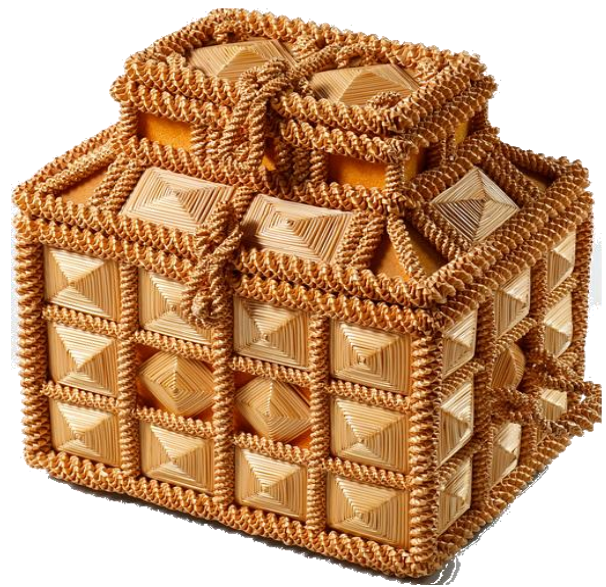
скринька з соломи