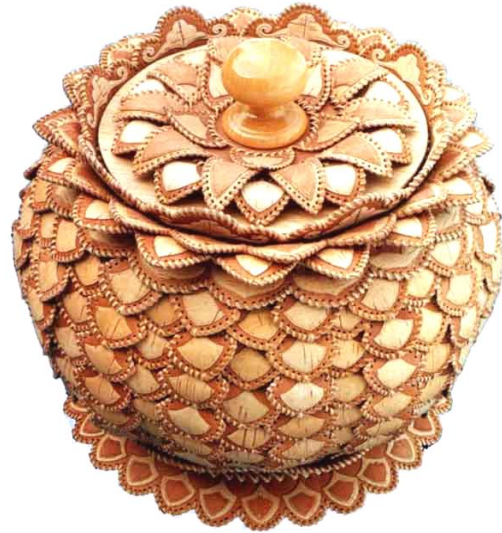
виріб з берести