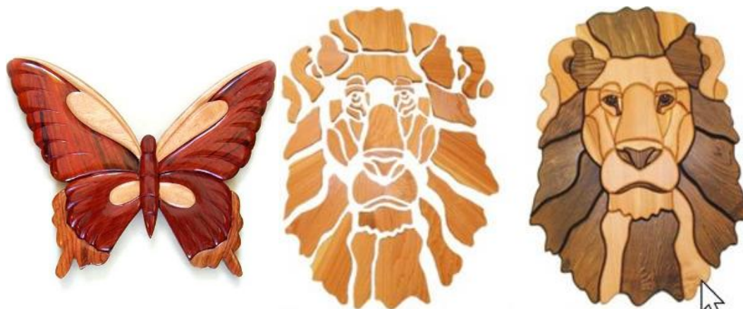
Рис. 4.3. Інтарсійні вироби

вкривають його поверхню (маркетрі). Таким чином найчастіше оздоблюють меблі, виготовляють декоративні панно тощо.