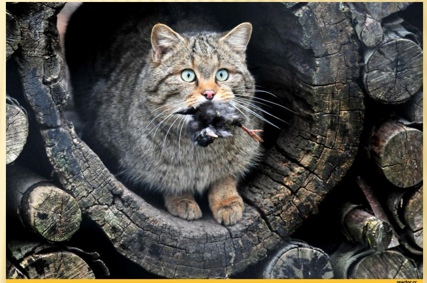
Кіт лісовий Felis silvestris

У 2009 р. вийшло третє видання Червоної книги України. До третього видання «Червона книга України» (рослинний світ) занесено 826 видів рослин і грибів: судинні рослини (611), мохоподібні (46), водорості (60), лишайники (52), гриби (57).