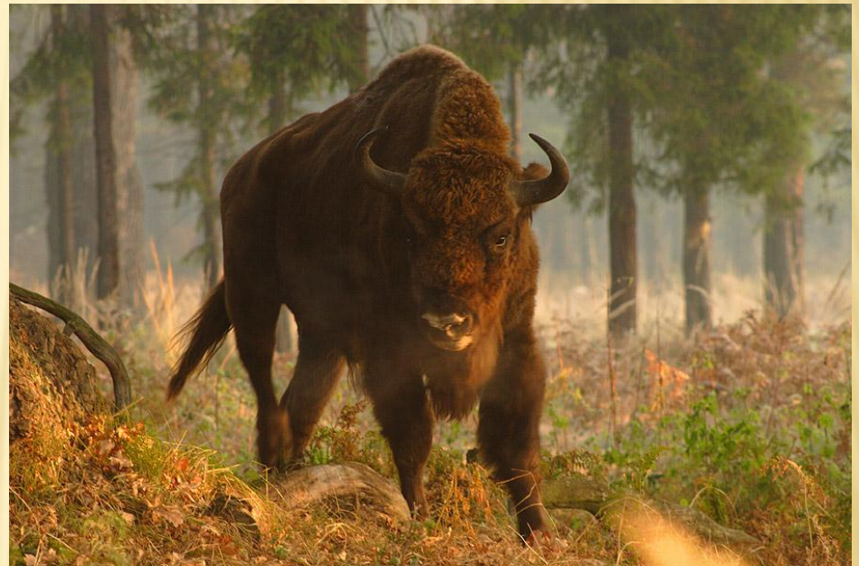
Зубр – Bison Bonasus

Червона книга України — анований та ілюстрований перелік рідкісних видів та підвидів, що знаходяться під загрозою зникнення на території України, і підлягають охороні; основний документ, в якому узагальнено матеріали про сучасний стан рідкісних, і таких, що знаходяться під загрозою зникнення, видів тварин і рослин, на підставі якого розробляються наукові і практичні заходи, спрямовані на їх охорону, відтворення і раціональне використання.