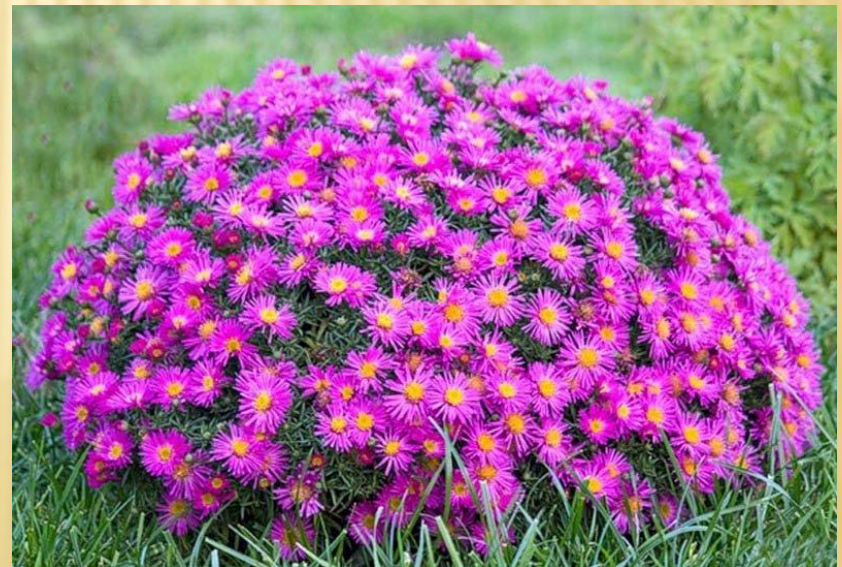
Айстра альпійська Aster alpinus

Для наукового забезпечення ведення Червоної книги України, підготовки пропозицій про занесення до Червоної книги України та вилучення з неї видів тварин і рослин, організації наукових досліджень, розробки заходів щодо охорони рідкісних і таких, що перебувають під загрозою зникнення, видів тварин і рослин, контролю за їх виконанням, координації діяльності державних органів та громадських організацій створена Національна комісія з питань Червоної книги України.