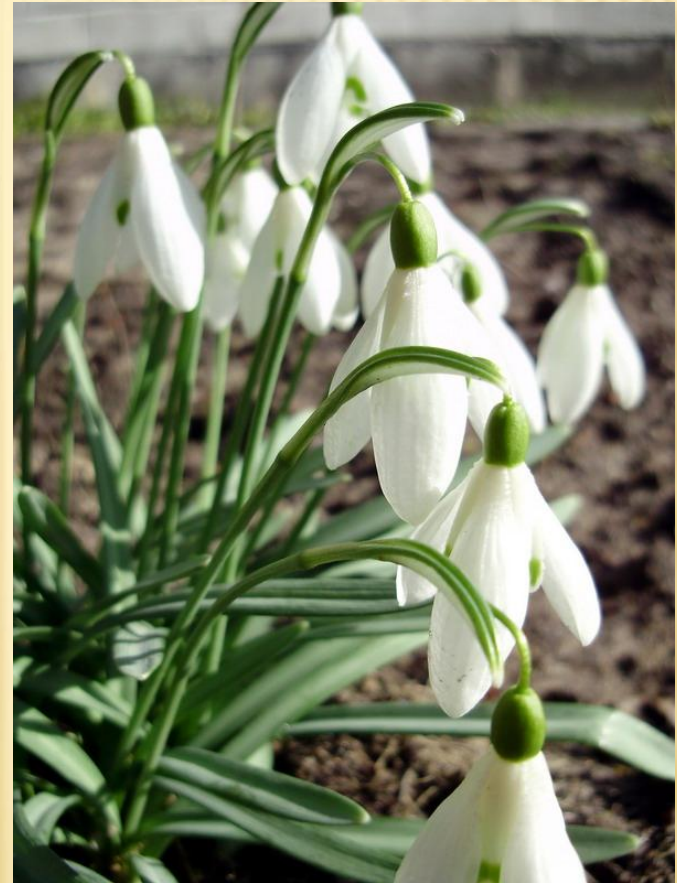
Підсніжник звичайний Galanthus nivalis

Кабінет Міністрів України забезпечує офіційне видання та розповсюдження Червоної книги України не рідше одного разу на 10 років.