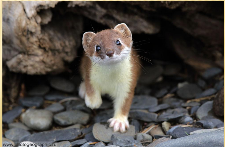
Горностаї Mustela erminea

У 2009 р. вийшло третє видання Червоної книги України. До нього занесено 542 види тварин: гідроїдні поліпи (2 види), круглі (2) та кільчасті (9) черви, ракоподібні (31), павукоподібні (2) та багатоніжки (3), ногохвістки (2), комахи (226), молюски (20), круглороті (2) та риби (69), земноводні (8), плазуни (11), птахи (87), ссавці (68). Кількість видів тварин у третьому порівняно з другим виданням збільшилась на 160 видів, а у другому порівняно з першим — на 297 видів.