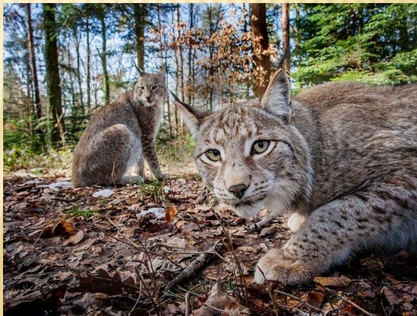
Рись - Lynx

Після набуття Україною незалежності у видавництві «Українська енциклопедія» було випущене друге видання Червоної книги України: в 1994 році — том «Тваринний світ» (наклад — 2400 примірників), в 1996 році — том «Рослинний світ» (наклад — 5000 примірників). З огляду на малий наклад ці два видання відразу стали раритетами. Друге видання нараховувало 382 види тваринного та 541 вид рослинного світу.