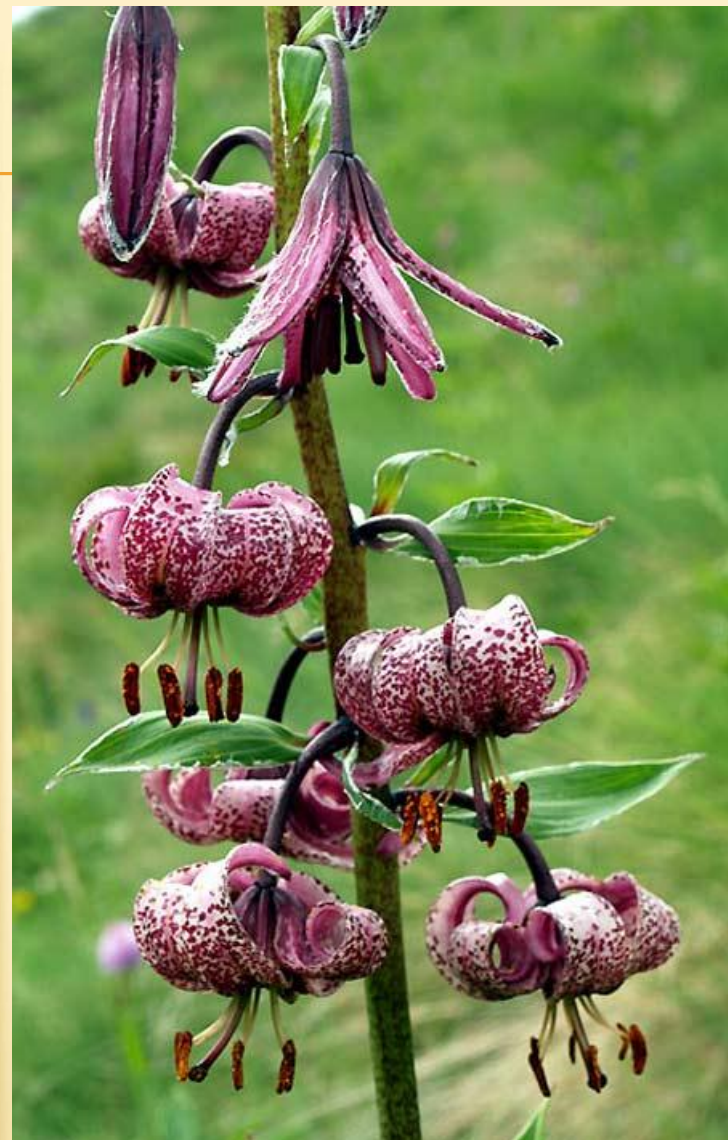
Лілія лісова Lilium martagon

В даний час в Україні відбувається поступове удосконалення законодавства про Червону книгу України. У грудні 2008 р. до Закону «Про Червону книгу України» були внесені важливі зміни, згідно з якими спеціальне використання об'єктів Червоної книги України з метою отримання доходу забороняється. Це дозволило припинити зловживання, пов'язані, наприклад, з проведенням комерційного полювання на зубрів під виглядом селекційного відстрілу.