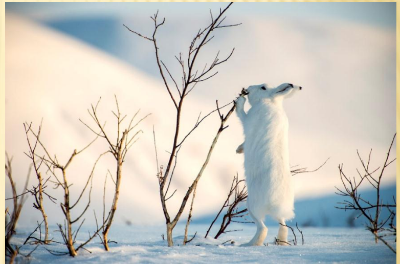
Заєць білий - Lepus timidus

Кількість видів рослин у третьому порівняно з другим виданням збільшилась на 285 видів, а у другому порівняно з першим — на 390 видів. Таким чином, з урахуванням приблизно однакових проміжків часу між виданнями Червоної книги України, спостерігається певне уповільнення темпів зменшення втрати різноманіття видів рослин і грибів України.