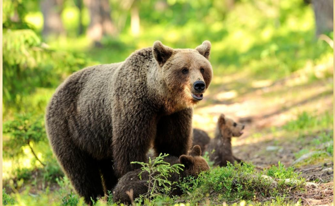
Ведмідь Бурий Ursus Arctos

Перша Червона книга, присвячена українській флорі та фауні, була видана у 1980 році під назвою «Червона Книга Української РСР». Перше видання Червоної книги України (1980 р.) містило опис 85 видів (підвидів) тварин: 29 — ссавців, 28 — птахів, 6 — плазунів, 4 — земноводних, 18 — комах і 151 вид вищих рослин.