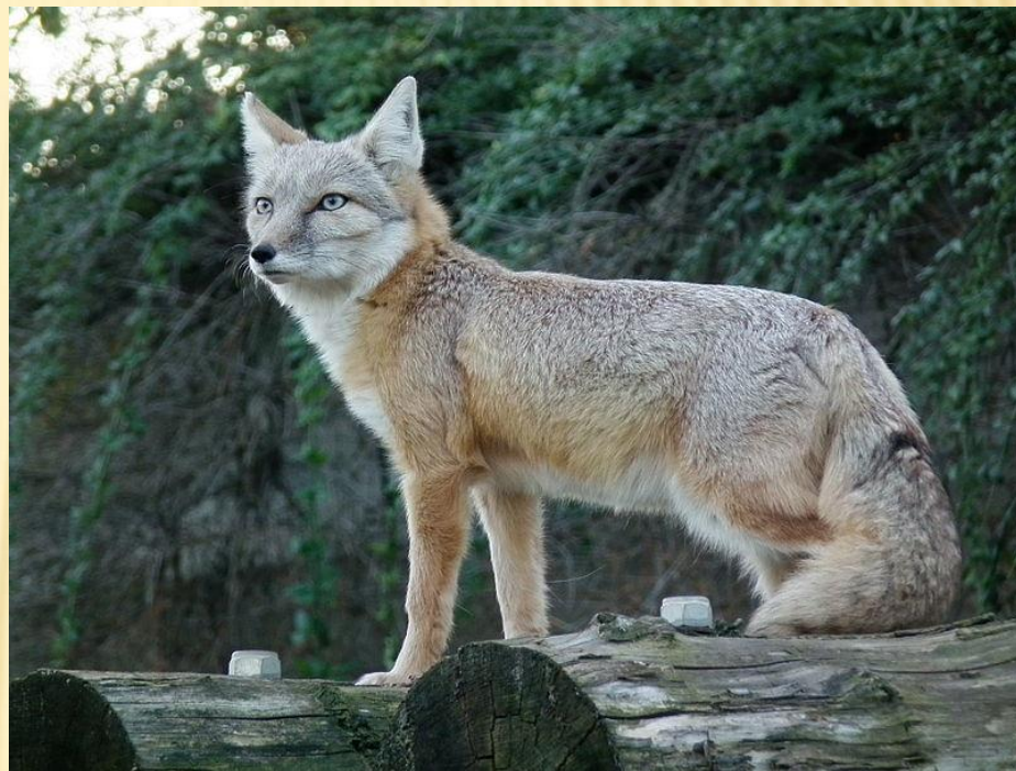
Лис степовий - Vulpes corsac

Кількість видів тварин у третьому порівняно з другим виданням збільшилась на 160 видів, а у другому порівняно з першим — на 297 видів. Таким чином, з урахуванням приблизно однакових проміжків часу між виданнями Червоної книги України, спостерігається певне уповільнення темпів зменшення втрати різноманіття окремих таксономічних груп фауни України. Разом з тим, викликає занепокоєння суттєве збільшення у Червоній книзі України кількості видів риб та ссавців.