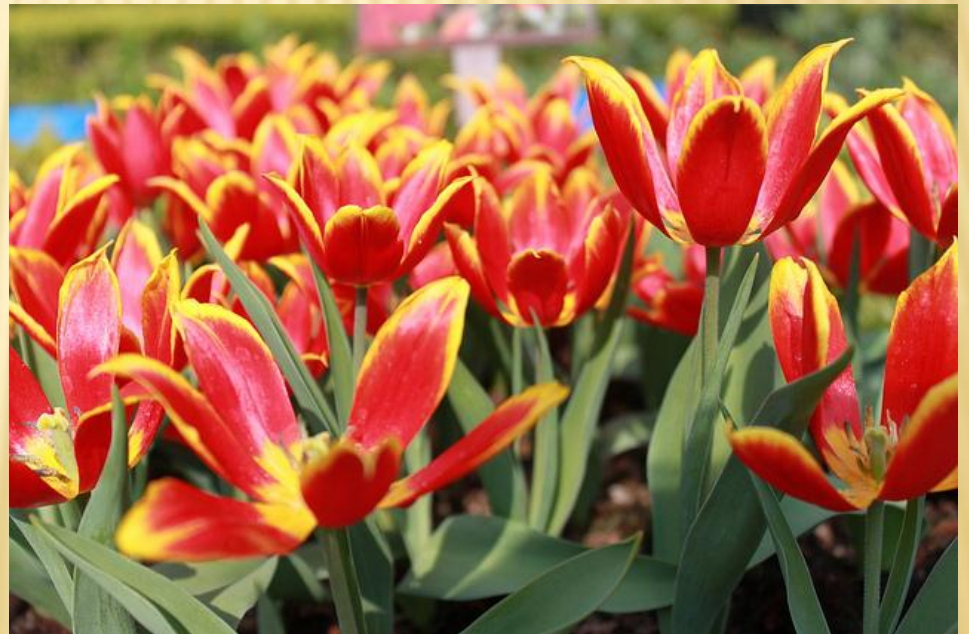
Тюльпан Шренка Tulipa schrenkii

Види тварин і рослин, занесені до Червоного списку Міжнародного союзу охорони природи та природних ресурсів і Європейського Червоного списку, які зустрічаються на території України, заносяться до Червоної книги України або одержують інший особливий статус відповідно до законодавства України про охорону та використання тваринного і рослинного світу.