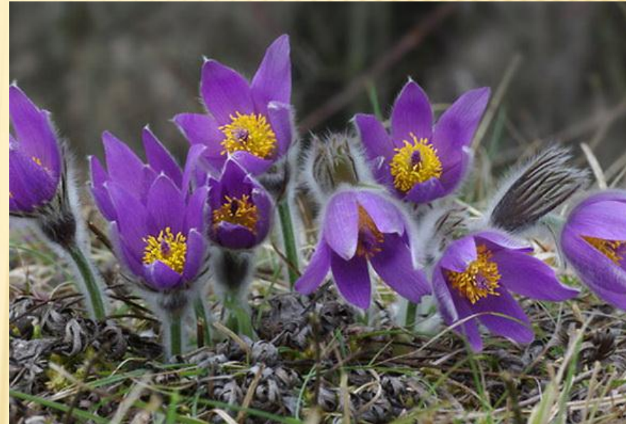
Сон великий Pulsatilla grandis

У липні 2012 р. до Закону «Про Червону книгу України» були внесені доповнення, згідно з якими до переліку об'єктів Червоної книги України внесено гриби, водорості і непатогенні мікроорганізми. Крім цього в поняття об'єктів Червоної книги України були включені не тільки рідкісні та зникаючі організми, що мешкають в природних умовах, але і в штучних умовах. Дана законодавча норма дозволила взяти під охорону Закону занесені до Червоної книги види організмів, що мешкають в зоопарках, зоосадах, ботанічних парках тощо.